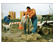
Dulce Pinzon Super-héros 16 mai-13 juil. 2013 Lyon 1er. Le Bleu du ciel