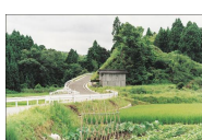
Thibaut Cuisset Paysage Document IV 03 mai-22 juin 2013 Paris 3e. Galerie Les Filles du calvaire