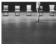
Anne Teresa De Keersmaeker Elena's Aria 14 mai-19 mai 2013 Paris 4e. Théâtre de la Ville