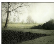
Ingar Krauss Garten. Nature morte 17 mai-22 juin 2013 Paris 14e. Galerie Camera Obscura