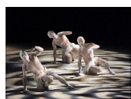
Ushio Amagatsu Umusuna. Mémoires d'avant l'histoire 02 mai-11 mai 2013 Paris 4e. Théâtre de la Ville